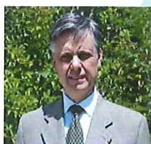
Lionel BEFFRE Préfet de l'Isère

"La première vocation de l'Etat est de protéger le pays contre les crises. Lors du premier choc de la crise sanitaire, les services publics ont organisé la protection de la population par des mesures sans précédent. Aujourd'hui, nous organisons la relance en mobilisant toutes les ressources économiques du pays. Entreprises, associations, collectivités, Etat : le plan France relance fournit des réponses et des leviers pour n'oublier personne.